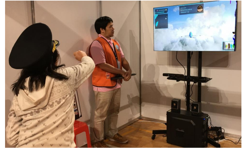
部分青年職涯發展中心提供虛擬職場、VR 實境體驗，圖為賈桃樂學習主題館

全國5處青年職涯發展中心，提供青年職業心理測驗、職涯諮詢、團體課程、履歷健檢、模擬面試，並鏈結就業服務及職業訓練資源，協助青年職涯規劃。